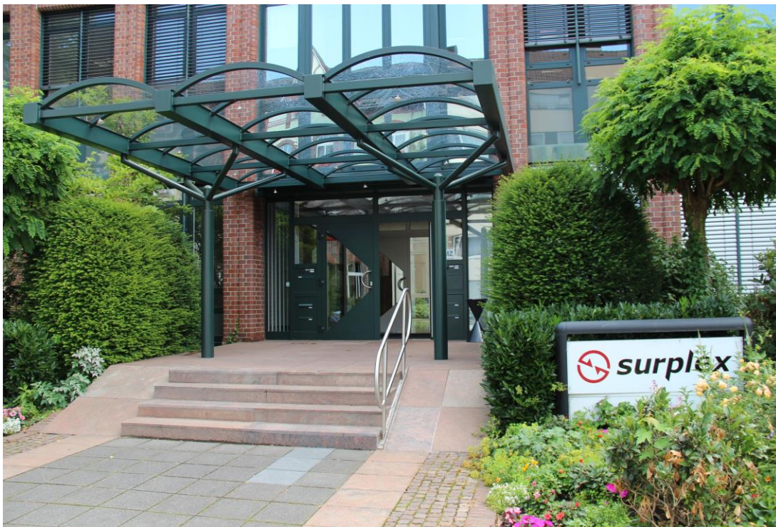
2009: Het eerste kantoor van de nieuwe Surplex GmbH