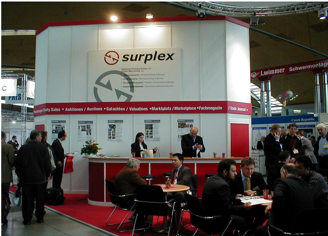
2007: Beursstand op de RESALE