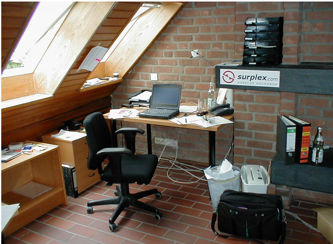
1999: Het eerste Surplex-kantoor