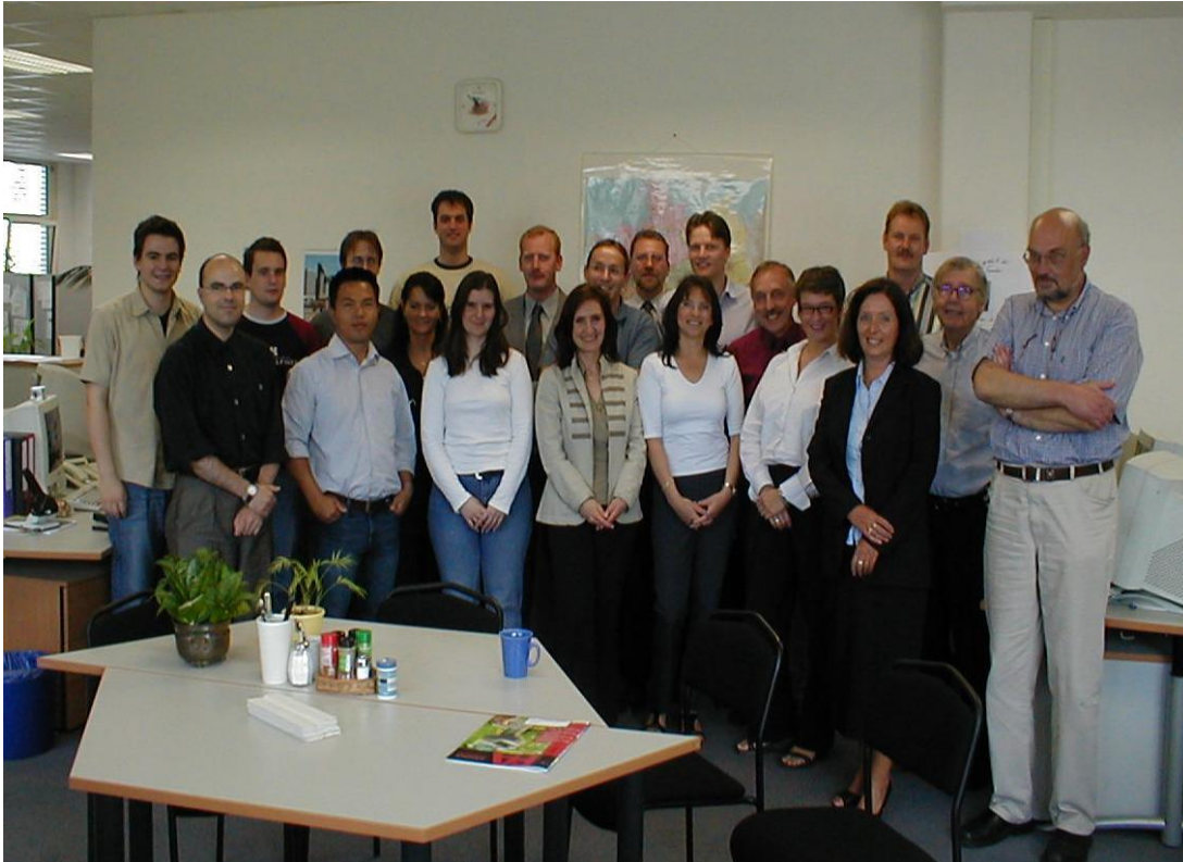
2004: Het volledige Surplex-team