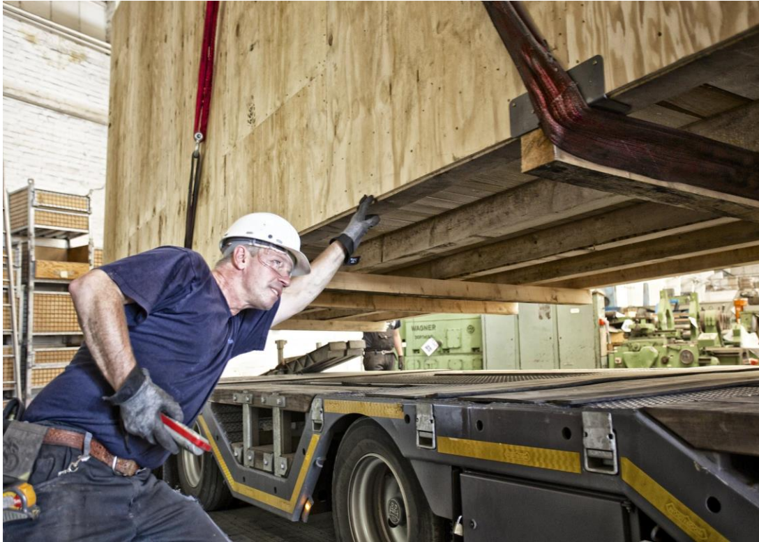
2011: Laden van machines